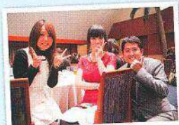
各テーブルに鉄穴社長がご挨拶へ回り、お客様と記念撮影