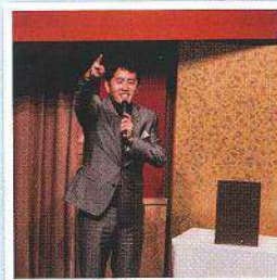
ヴィトンが景品に加わり、じゃんけん大会で白熱の会場