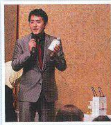
エンピロンの「ラボリス・ボディシャンプー」と「ラハテア」が今回のサブプライズプレゼント。「ラハテア」は女性に人気の大変香みやすいヨーグルトのリキュール。乳酸菌入りなので腸内環境も良くなるという嬉しいお酒

私達スタッフも楽し嬉しく、素晴らしいひと時となりました。お越し頂いた会員の皆様、本当に有難うございました。