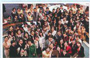
最後は会場の会員様とスタッフ全員で「恋文ちゃんポーズ」！皆様有難うございました