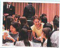
各テーブルにスタッフが回ってお渡ししました